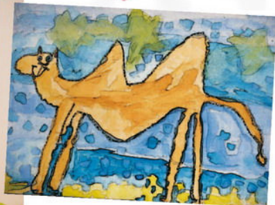
Redakce Dobrého pastýře