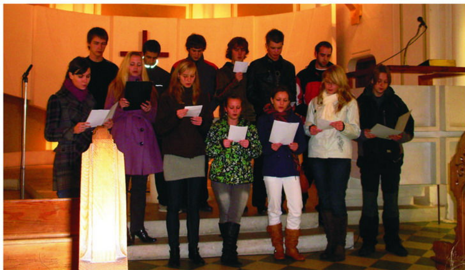
Studenti z oktávy krnovského gymnázia na koncertě v evangelickém kostele