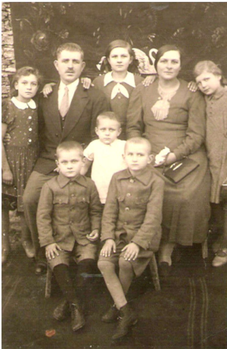
Nejmłodší z rodiny Jankových.