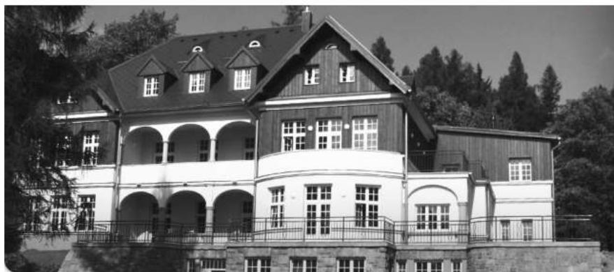
Bývalá LDNka je nyní krásně zrekonstruována.