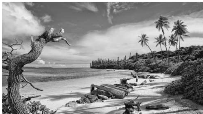
Krásné pobřeží Nové Kaledonie