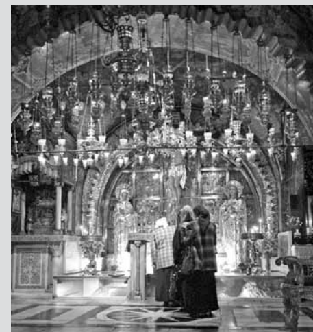
• Tradiční místo Golgoty v kostele Svatého hrobu

Když dnes řekneme „Golgota“, nevybaví se nám asi hned otázka topografie, ale událost