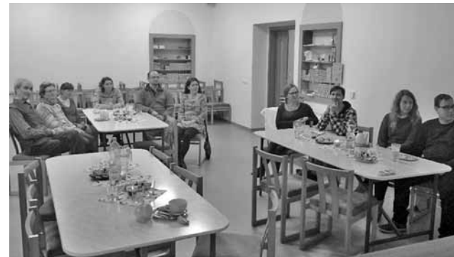
• Letošním tématem Národního týdne manželství bylo Manželství v síti.

Překvapilo mne, nebo mě to možná nenapadlo, jak velký vliv má na manželství samotný stát a jeho představitelé a vládní systém. „Systém snižuje (byť někdy nepřímo) váhu manželství... Cílem má být silná a stabilní společnost, jejíž základní jednotkou vždy byla rodina. To vše ostatní (infrastruktura, platy, trh práce, ekonomika, politika) jsou jen okrajové věci. Rodina měla vždy svůj program, poslání či poselství předávané z generace na generaci. Z dědy na otce, z otce na syna, vnuka... Žel, současná situace ve společnosti nahrává těm, kteří si chtějí prosadit svou politiku, která s rodinou příliš nepočítá a spíše je na obtíž, protože je silnou buňkou, která odolává vlivům z vnějšku. Když