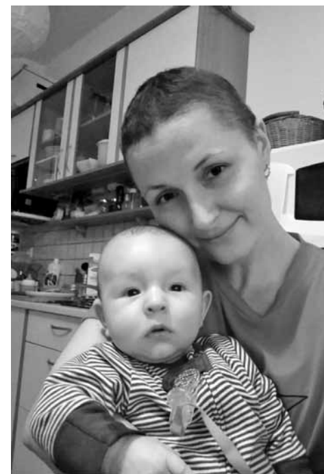
• Dcera Dita se synem.