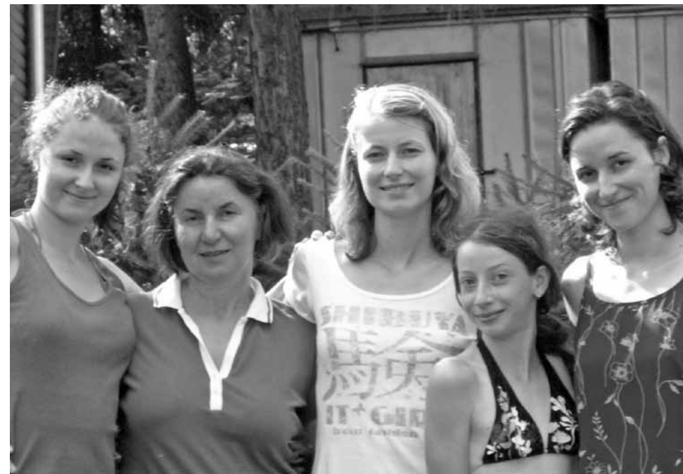
• S dcerami a vnučkou.