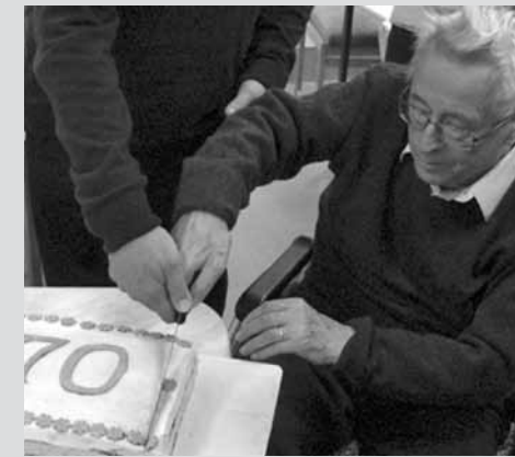
• Při krájení dortu během výročí 70 let sboru, říjen 2019