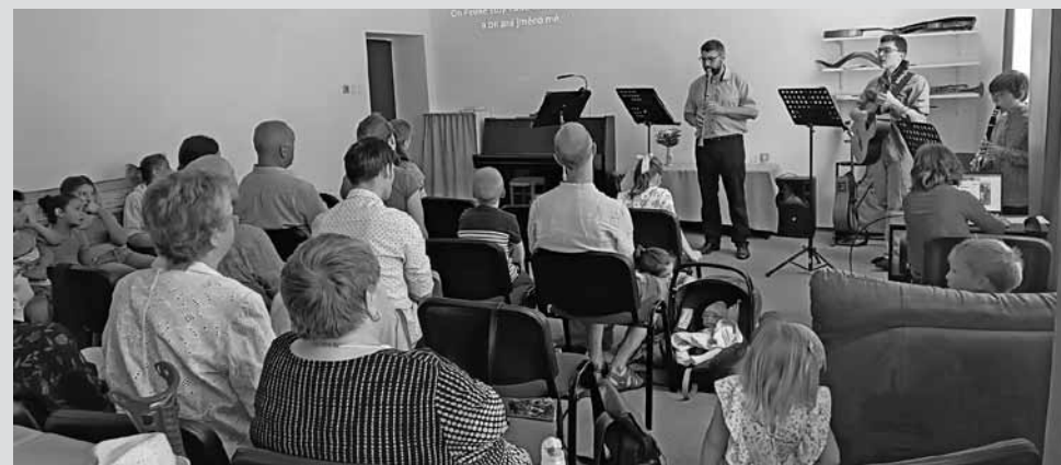
• Společná bohoslužba v křesťanském společenství Tesalonika