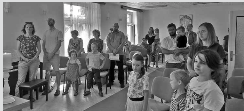
• Červencova bohoslužba s bratry a sestrami z místní Církve bratrské

Cílem je oslovit širší veřejnost a nabídnout modlitbu či rozhovor potřebným.