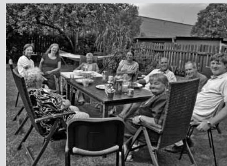
• Tradiční zahradní posezení po bohoslužbách