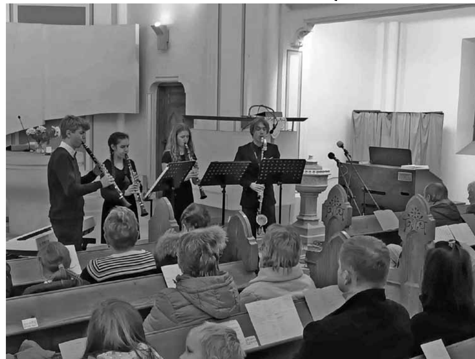
• Koncert ZUŠ

Vzhledem k tomu, že po povodních byl krnovský kostel jediným zachovalým koncertním prostorem v Krnově, mnozí uvítali možnost přijít si poslechnout zajímavou muziku nebo i společně si zazpívat. Nabídka byla docela bohatá: