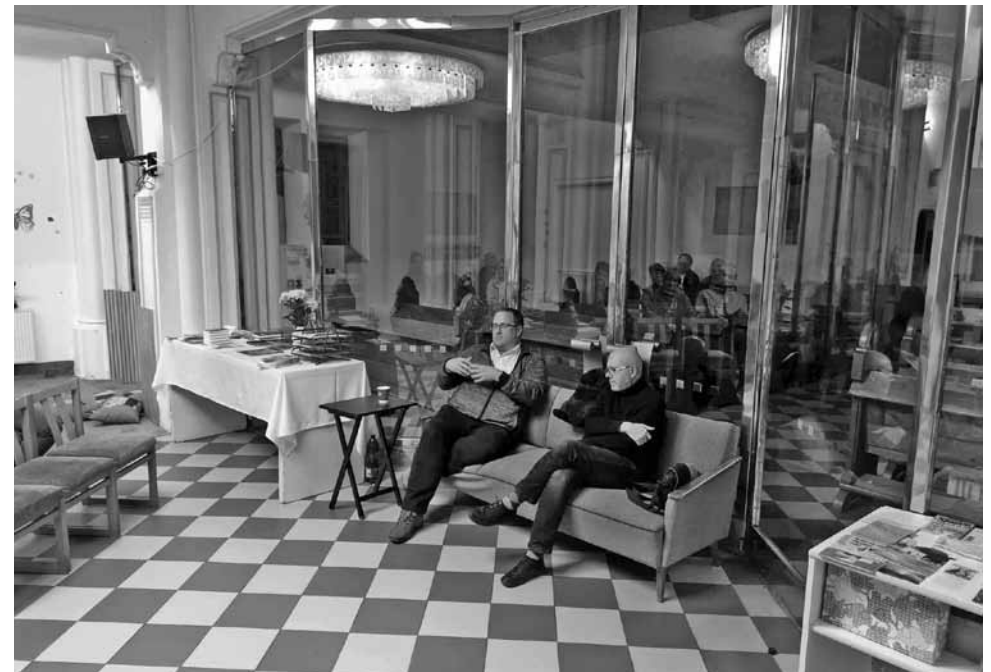
• Člověk v džungli paragrafů