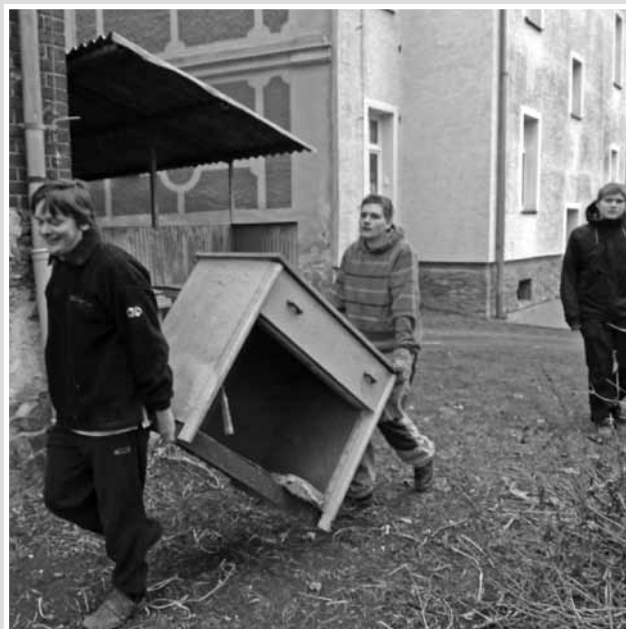
• Vynášení nepořádku z půdy