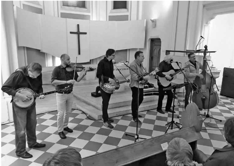
• Koncert kapely BG Styl