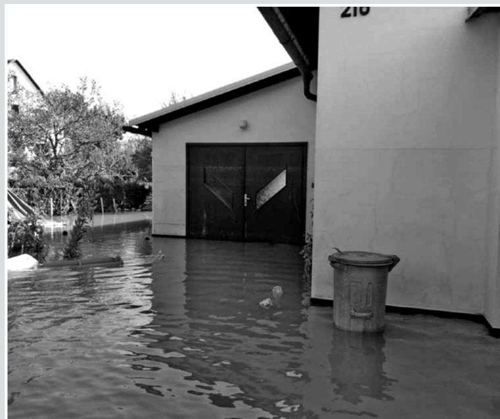
• Voda začala opadat a Kunáškoví se mohli vrátit domů