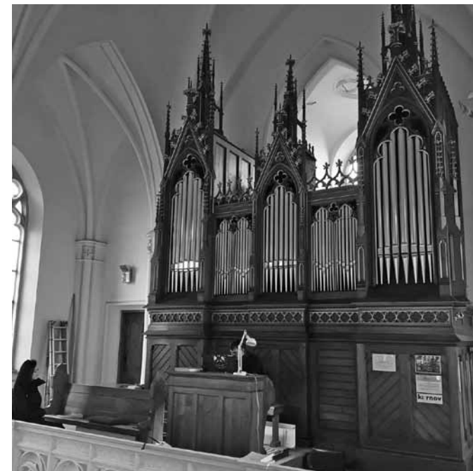
• Nově opravené varhany