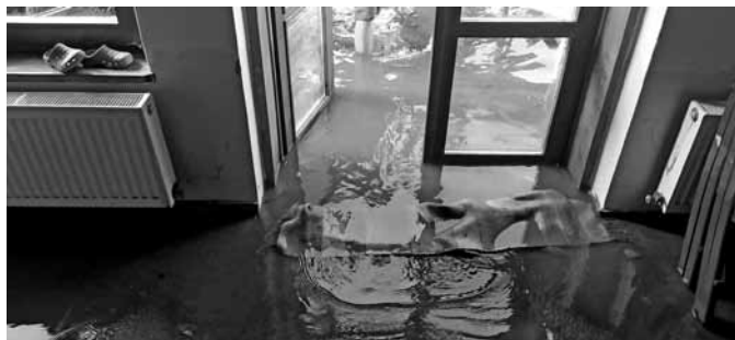
• Zaplavená budova a zahrada bruntálské fary

Letošní povodeň způsobila nemalé škody na suterénní přístavbě našeho sborového domu. Do odstraňování následků velké vody se průběžně zapojilo několik dobrovolníků z blízka i daleka. Prostory se podařilo vyčistit, odstranit znehodnocené podlahy, obložení, kuchyňku a další vybavení, zahájilo se vysoušení. V současné době se pokračuje v diskuzi, jakým způsobem přístavbu chceme dále využívat. Plánují se jednotlivé kroky oprav a případných změn. Poděkování patří všem, kteří se jakýmkoliv způsobem zapojili a doposud podpořili obnovu našeho sborového zázemí. Děkujeme za každou praktickou i finanční pomoc.