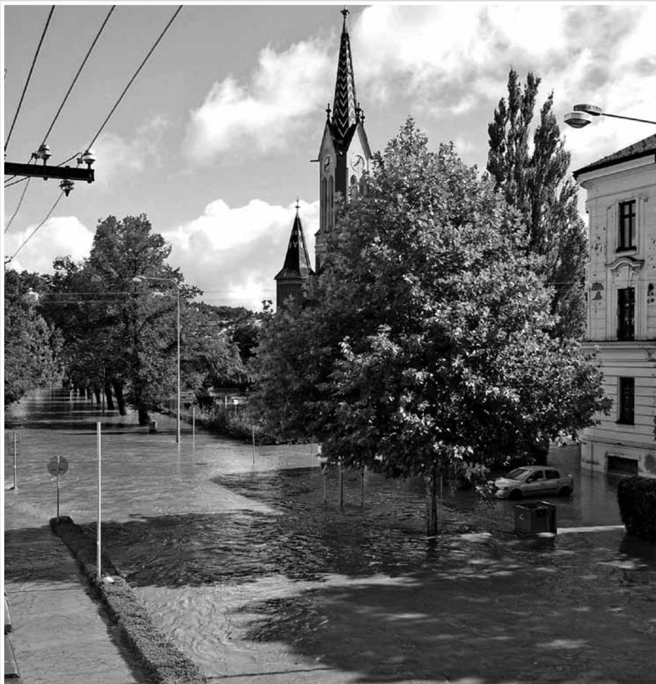
• Pohled z fary na kostel

Napriek tomu, že sme boli všetci vyčerpaný, boli sme stále ochotný pokračovať v pomoci, pretože sme videli potreby všetkých tých ľudí.