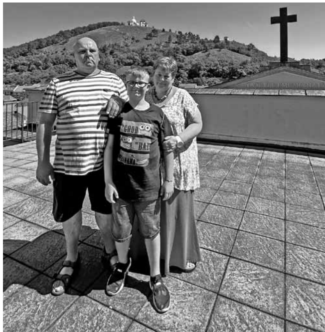
● S manželem a vnukem