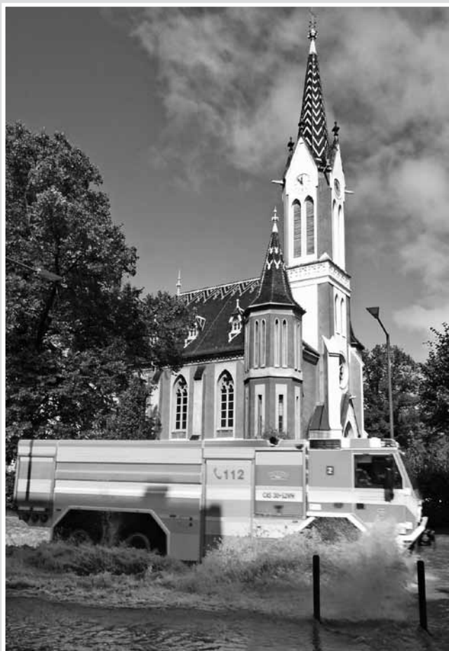
• Je 11 hodin, odpoledne voda kulminovala

Během pátečního odpoledne, kdy začalo vydatněji pršet, jsme viděli, že hladina řeky Opavy začíná očividně stoupat. Během sobotního podvečera jsme byli místním rozhlasem informováni, že řeka Opava dosáhla 3. stupně povodňové aktivity, byla vyhlášena nařízená evakuace občanů ze záplavové oblasti a následně zazněla siréna. Poté jsme byli bez proudu a dalších informací. Všichni sousedi jsme se intuitivně shromáždili v naší uličce a debatovali jsme o tom, zda se přemístíme do evakuačních center