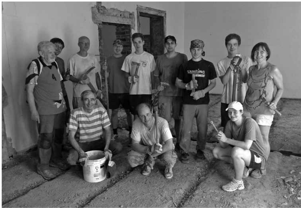
• Skupina brigádníků, rok 2015