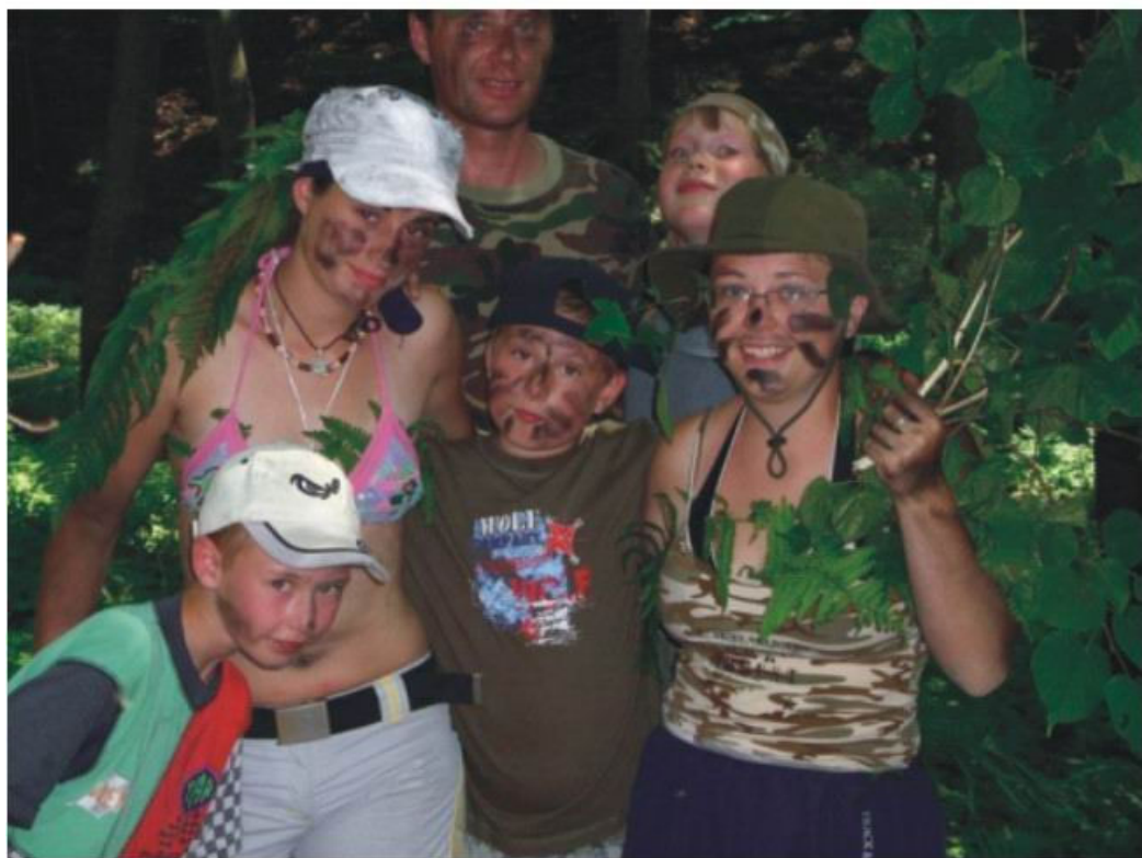
Bojovky byly letos hodně „akční“

Tábor sice skončil, ale my už jsme se sešli na potáborovém srazu a budeme pokračovat s našim klubem Smajlíků 😊, jak se můžete dočíst v pozvánce, která je v časopise. Fotografie z tábora je možné si prohlédnout na internetových stránkách našeho sboru v rubrice „galerie“. Adresa je: http://krnov.evangnet.cz .