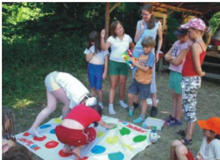
Jedna z oblíbených her ve volném čase - Twister