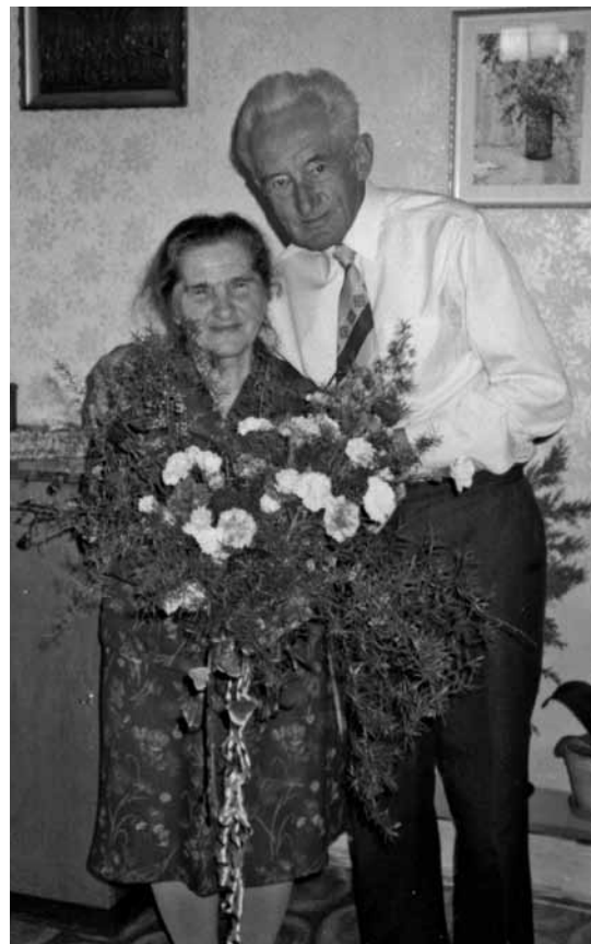
• Manželé Kielaroví